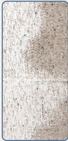
一般的な シーリング材

一般的なシーリング材では、塗装の種類によって、塗膜への汚染や、密着不良が発生することがありますが、ノンブリードタイプのシーリング材では、汚染性・密着性とも良好な結果が得られております。