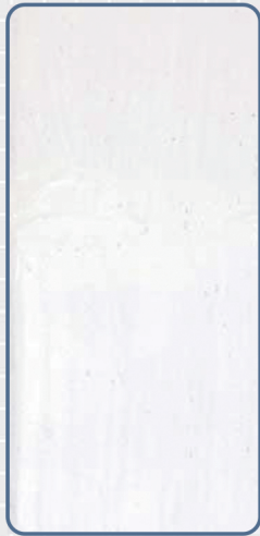
ノンブリードタイプの シーリング材